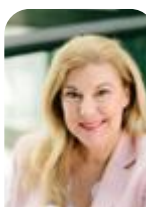
Meta Günther W&V Wer Wo Was und W&V Markt

Tel.: 089/2183-7073 E-Mail: micaela.marti@wuv.de