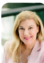
Meta Günther W&V Wer Wo Was und W&V Markt

Tel.: 089/2183-7073 E-Mail: micaela.marti@wuv.de