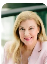
Meta Günther W&V Wer Wo Was und W&V Markt

Tel.: 089/2183-7073 E-Mail: micaela.marti@wuv.de